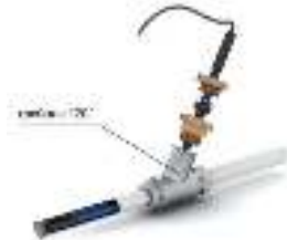
Рис. 4 - Схема ввода нагревательной секции внутрь трубопровода под углом 120°