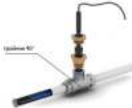
Рис. 3 - Схема ввода нагревательной секции внутрь трубопровода под углом 90°